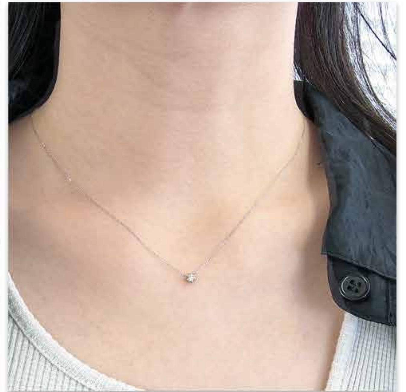
Bezel setting -フクリン-