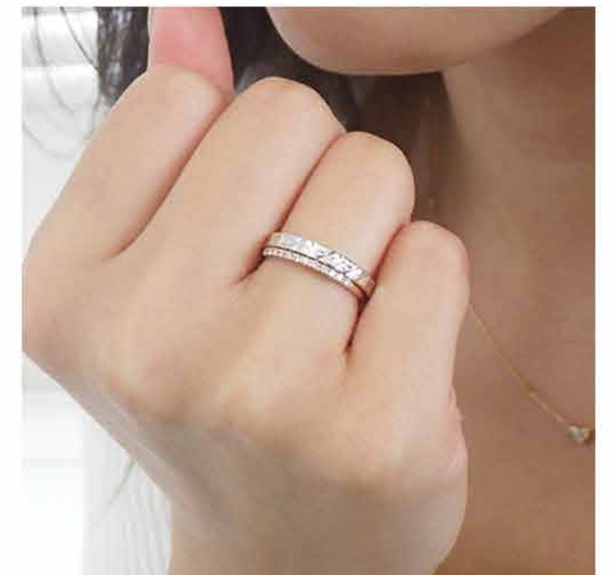
重ね付けで手元がブラッシュアップする