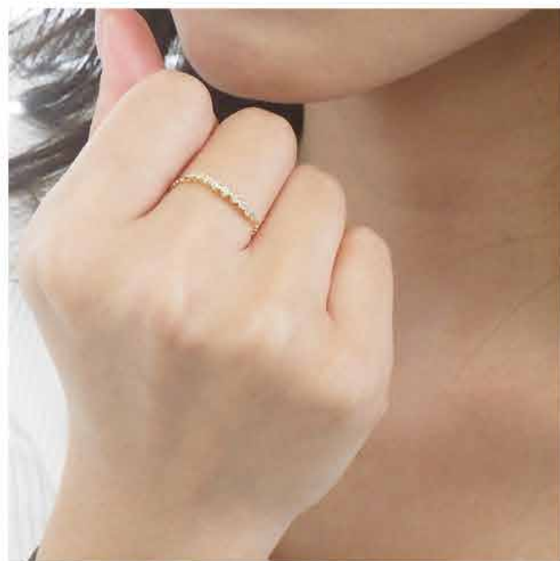
繊細な輝きはグラデーションの効果

気分によって、服装に合わせて、着ける指を選びたい！そんな願いに応えるフリーサイズリング。1～21号サイズまで対応可能です。9石のダイヤモンドは輝きを魅了するグラデーション仕様。ダイヤモンドを包む台座となる枠は個々にジョイト加工を施し、モチーフが緩やかに可動することで、指に馴染みよく寄り添い心地よいフィット感を得られます。アーム部分は1.0mmのボールチェーンを使い、シリコン入りのアジャスターボールを持ちスライドすることで好きなサイズに調整することが出来ます。またチェーンのエンドには小さなダイヤモンドを添えたチャームがきらりと輝き、手のひらからも”可愛い”が溢れています。