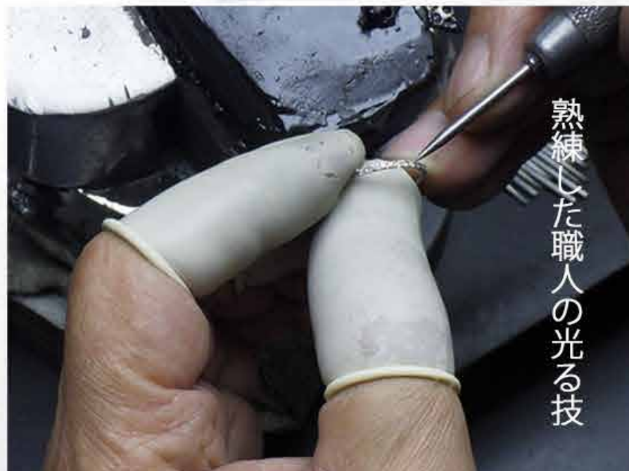
熟練した職人の光る技

しなやかに指に馴染む0.1カラットのエタニティリング。手元をふと見るたび、眩いダイヤモンドの輝きに笑みがこぼれます。主張しないシンプルな存在感が、お手持ちのリングとの重ね付けで相乗効果をもたらします。1粒デザインと並んで、今や必需品のエタニティリング。気負わずデイリーにお使いいただけるサイズ感です。着け心地同様、大切なのが強度です。永くお使いいただきたいから石外れを最大限防止するよう、4本の爪を使い職人の手作業によって1石1石丁寧に留めました。ダイヤモンドの輝きとデザインを邪魔しない小さな爪は滑らかで繊細な仕上がりです。