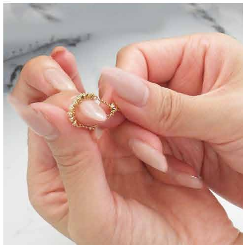
スライドボールでサイズの調整ができます