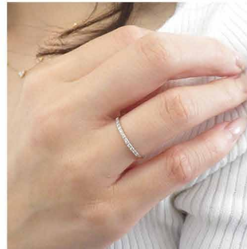
華奢&シンプルが素敵